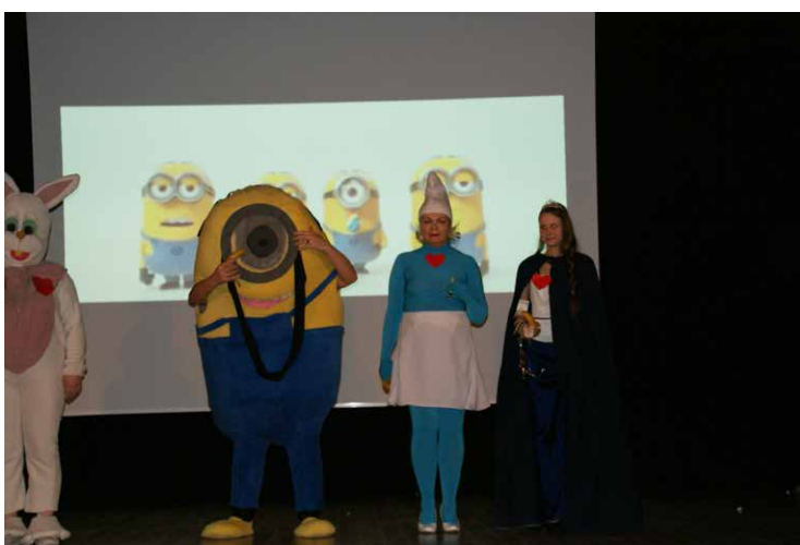
Vecāku radošie priekšnesumi ataino bērniem zināmas lietas un runā arī par sabiedrībā aktuālo.