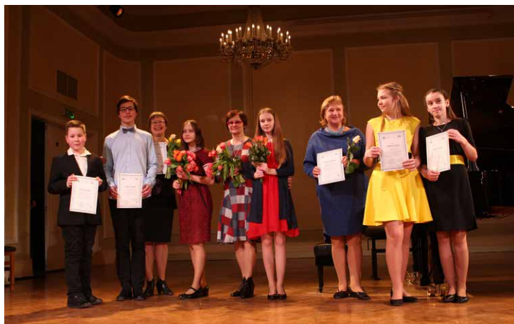
Rīgas 6. vidusskolas dalībnieki un pedagogi.

Visiem priecīgs paldies! Mums izdevās lielisks koncerts! Tiekamies nākamajā gadā! ■