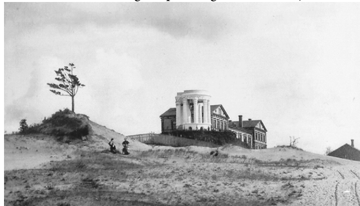
1900. gadā darbību sāka speciāli bērniem projektēta Zaļā skola.