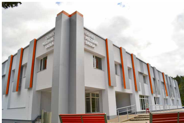
Ogres Mūzikas skola.