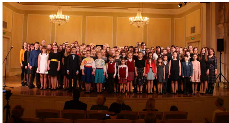
Visi noslēguma koncerta dalībnieki, pedagogi un viesmākslinieki.

Festivālu rīko NODIBINĀJUMS JAUNO PIANISTU FESTIVĀLS KLAVIERES POPULĀRAJĀ MŪ-