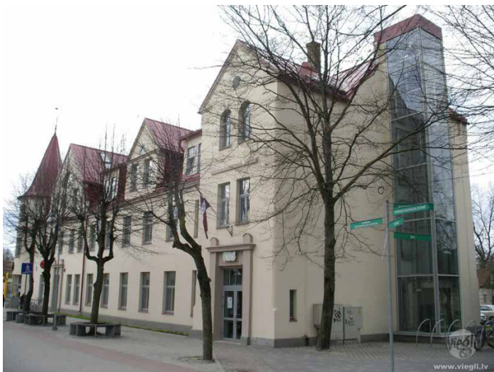
Ogres Mākslas skola.

Līdztekus skolu tīkla sakārtošanai, skolu reorganizēšanai un slēgšanai notiek mēģinājumi arī apvienot profesionālās ievirzes izglītības iestādes. Ogres novada domes deputāti nolēma apvienot Ogres Mūzikas skolu un Ogres Mākslas skolu. Nav runa par mazu skolu ar nelielu bērnu skaitu apvienošanu, bet divu spēcīgu skolu reorganizāciju. Lēmumprojekts par skolu apvienošanu radījis sabiedrībā satraukumu par tālāko mācību procesu abās skolās, ir daudz neatbildētu jautājumu arī skolu pedagogiem. Lēmuma pieņēmēji apgalvo, ka tā būs labāk, tā dara arī citur, tādēļ nav rīkotas pat īpašas diskusijas. Tas dara uzmanīgu par to, kā tiek pieņemti lēmumi un vai tā var izveidot kvalitatīvu kultūrvidi, kas esot arī viens no ieceres mērķiem.