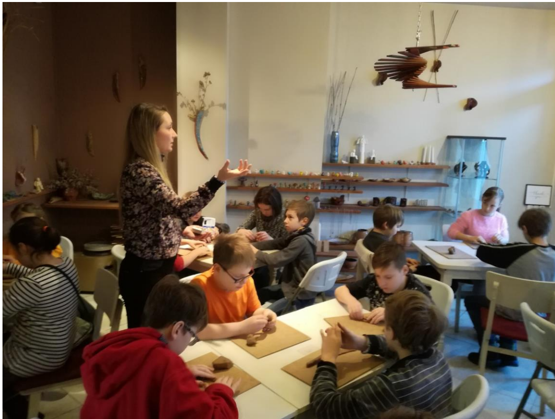
Viesošanās keramikas darbnīcā pasākumā «Māls mūsu rokās»