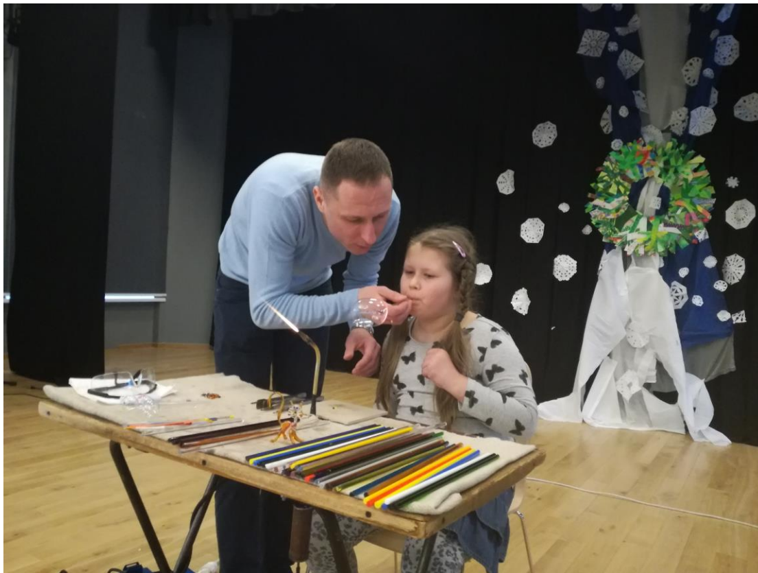
Ventspils stikla pūtēju viesošanās skolā